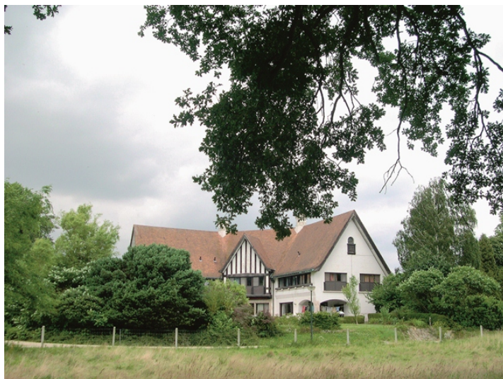
De villa van het Neromhof, heropgebouwd na de Tweede Wereldoorlog