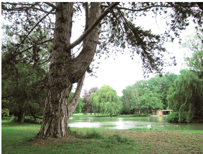
De rond 1905 aangelegde landschappelijke vijver bij het Neromhof