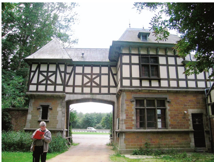
Het poortgebouw met de portiersloge bij het Neromhof werd in de jaren 1920 gebouwd