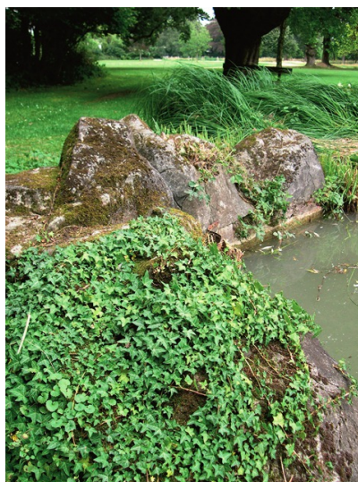
De met rotswerk gecamoufleerde overloop van de vijver bij het Neromhof