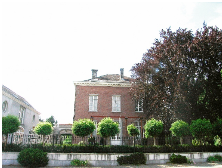
Villa ter Biest vanaf de straat