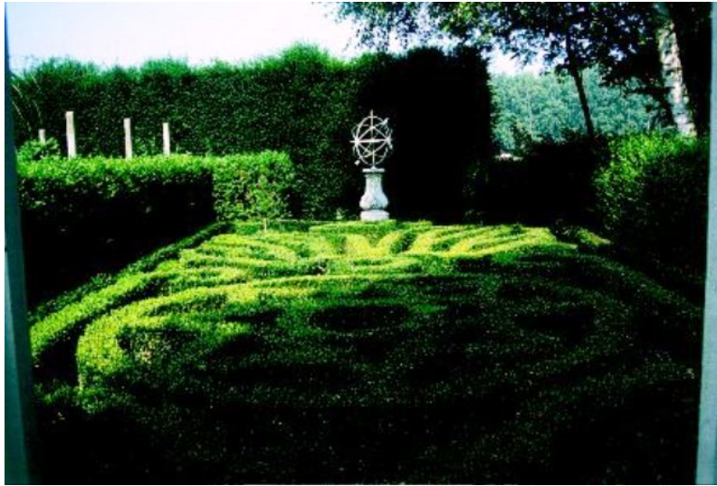
Buxusparterre bij villa Ter Biest