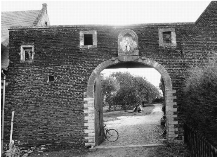
Toegangspoor naar het voormalig kloostercomplex.