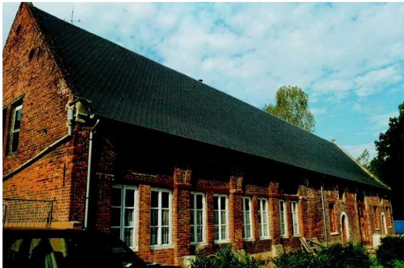
Oude kloostervleugel van Gempe, hergebruikt als koetshuis.