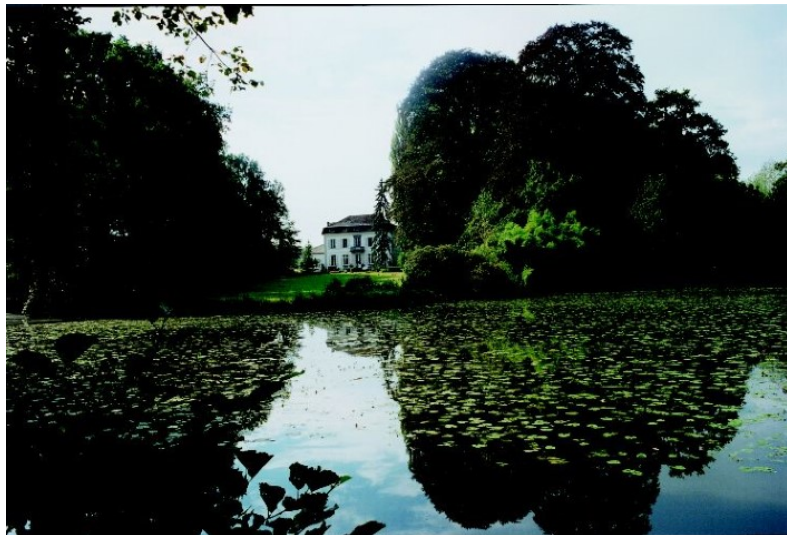
Het kasteel gezien van over de met gele plomp bedekte vijver.