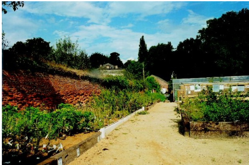
De oude ommuurde kloostertuin.