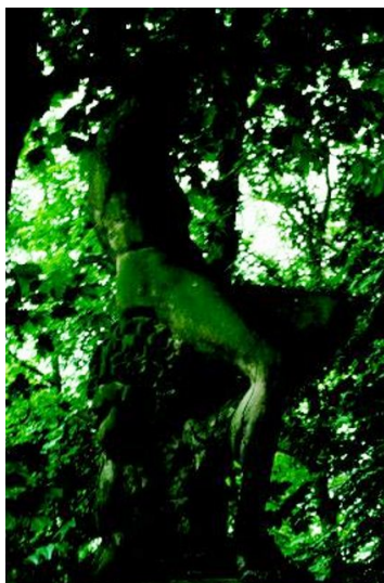
Nu verdwenen beeld in de tuin van brouwerij Cerckel te Diest