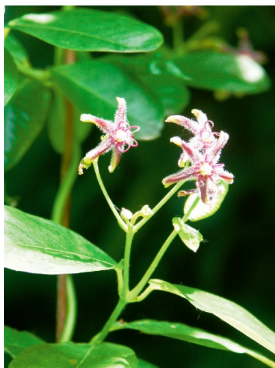
Bloeiende melkwingerd ( Periploca graeca) in het park van brouwerij Cerckel