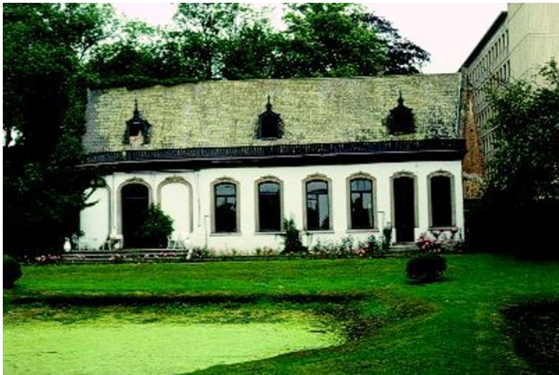
“Lusthuis” in de tuin van brouwerij Cerckel te Diest, een verbouwing uit 1881 van de voormalige infirmerie van het Minderbroederklooster