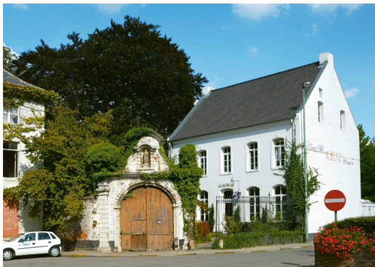
Woning bij brouwerij Cerckel te Diest, met inrijpoort en rondboogpoort van het voormalige Minderbroederklooster