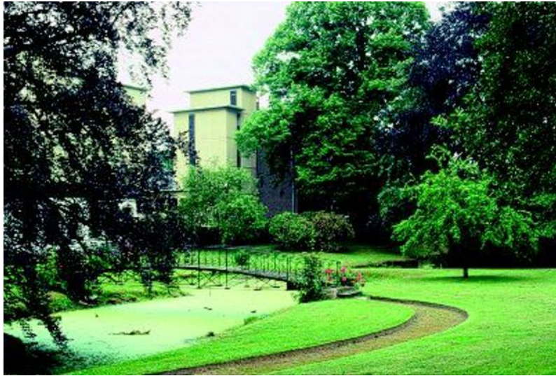
Noordelijk gedeelte van de vijver en de smeedijzeren boogbrug in de tuin van brouwerij Cerckel te Diest; op de achtergrond een monumentale zilverlinde en de hoogbouw van de Sint-Jozefskliniek