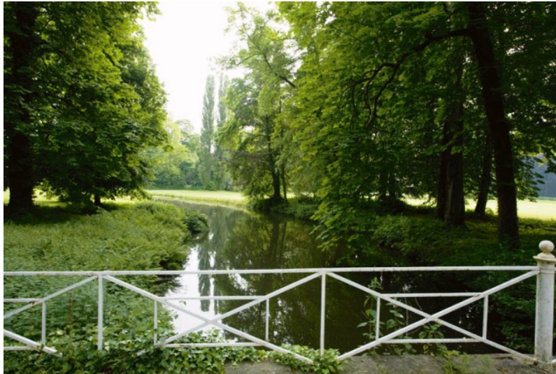
Zicht op de meanderende waterloop en Italiaanse populieren in het kasteelpark van Wilder