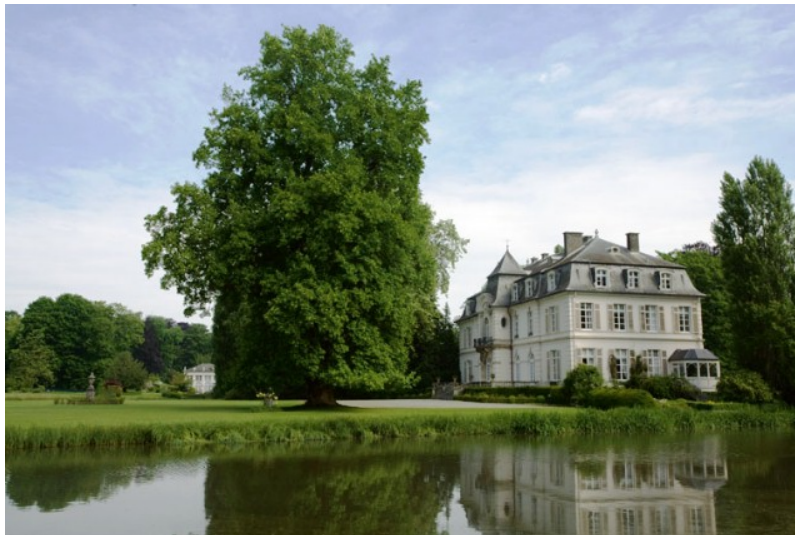
Oranjerie en op voorgrond serpentinevijver bij het kasteel van Wilder