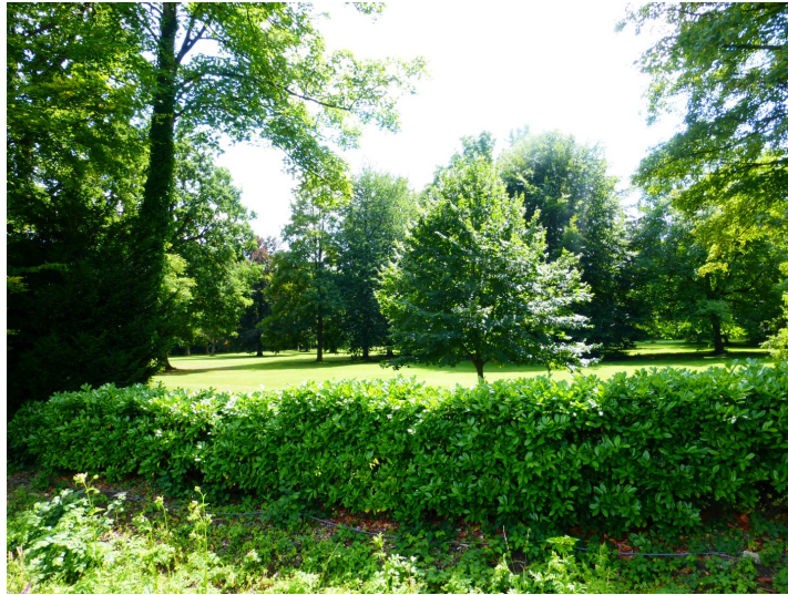
Kamphenhout, Balkestraat, tuin bij kasteel van Wilder