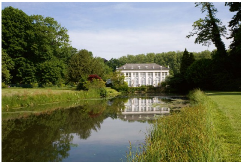
De 'rivier' in het Engels park van Wilder eindigt aan de voet van de oranjerie