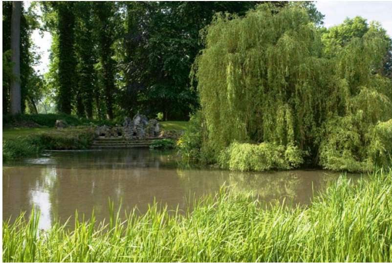
Serpentinevijver en rotspartij van de zuidelijke arcade bij het kasteel van Wilder