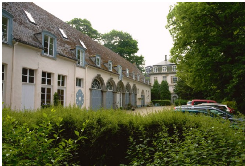
Koetshuis en noordgevel van het kasteel van Wilder