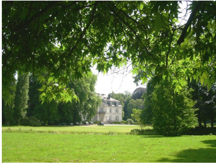
De westgevel van het kasteel van Wilder