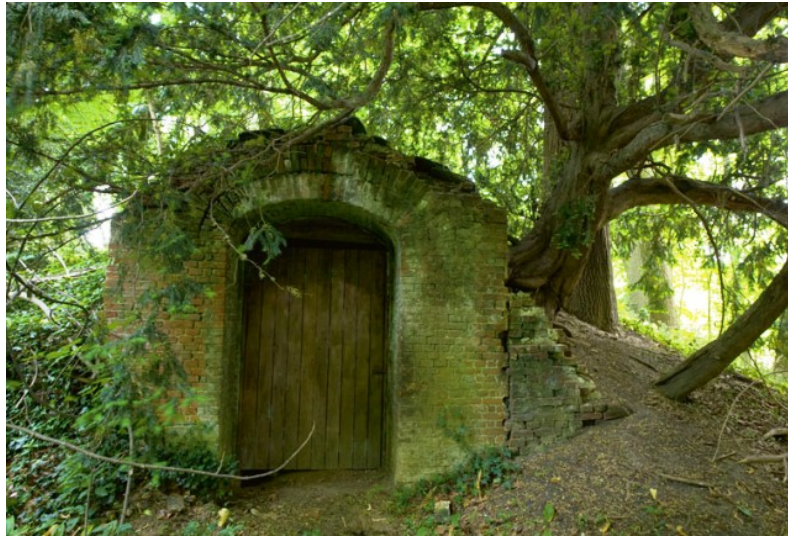
De ijskelder met oude taxussen bij het kasteel van Wilder