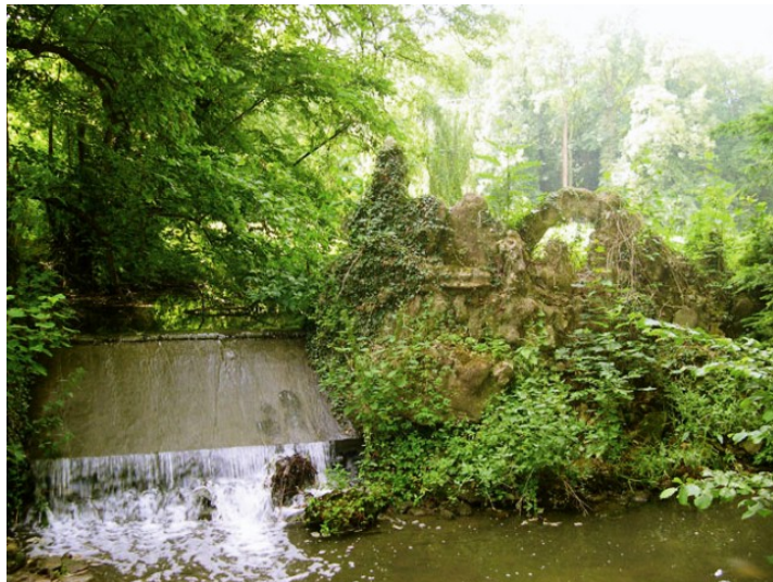
Rotscascade bij het kasteel van Wilder