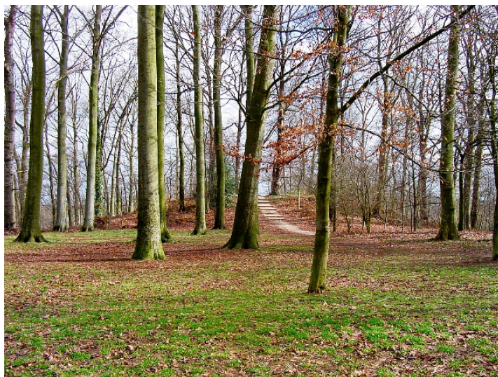
Oude donjonmotte op de Warandeheuvel te Diest, nu lindenprieel in landschappelijk park