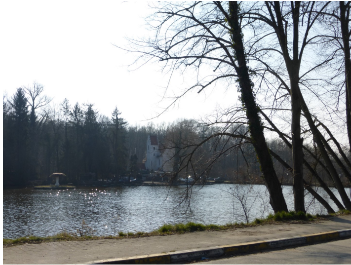
Oud-Heverlee Zoet water