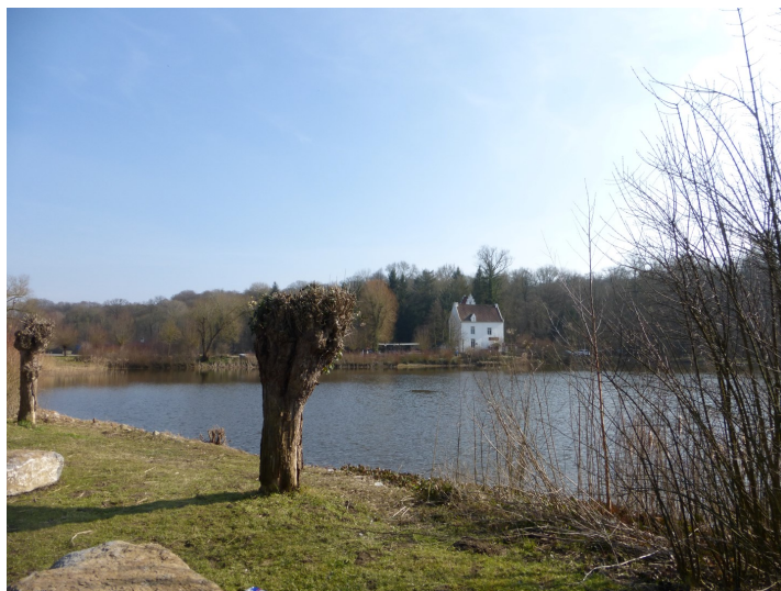
Oud-Heverlee Zoet water