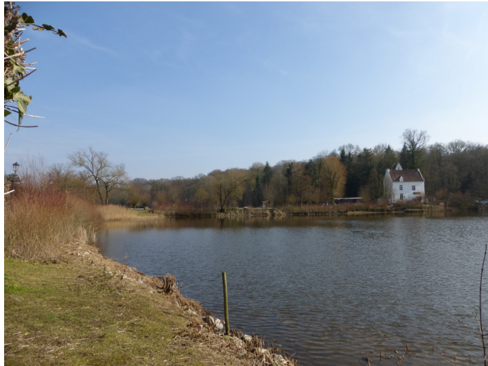
Oud-Heverlee Zoet water