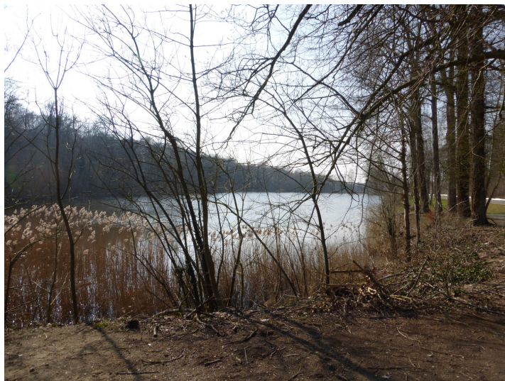
Oud-Heverlee Zoet water