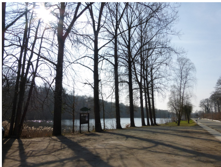
Oud-Heverlee Zoet water