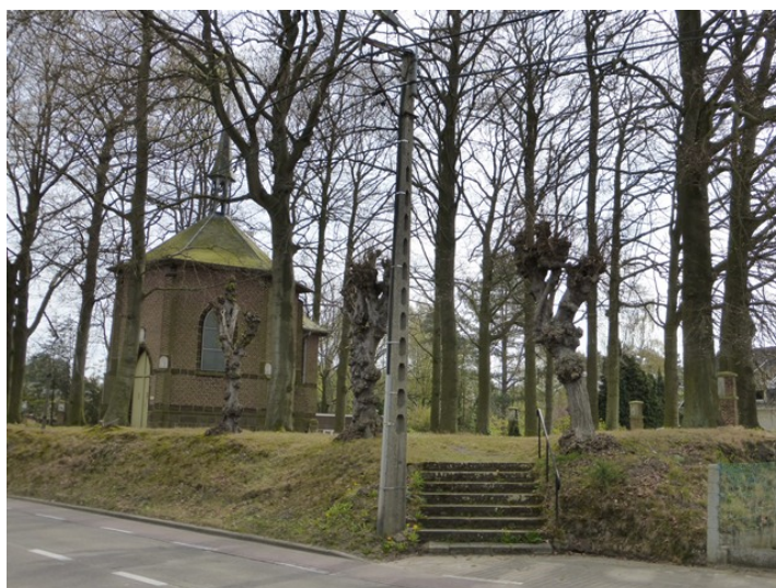
Rotselaar Steenweg op Wezemaal zonder nummer kapel