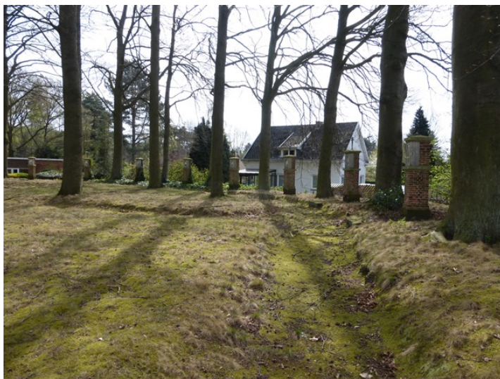
Rotselaar Steenweg op Wezemaal zonder nummer kapel