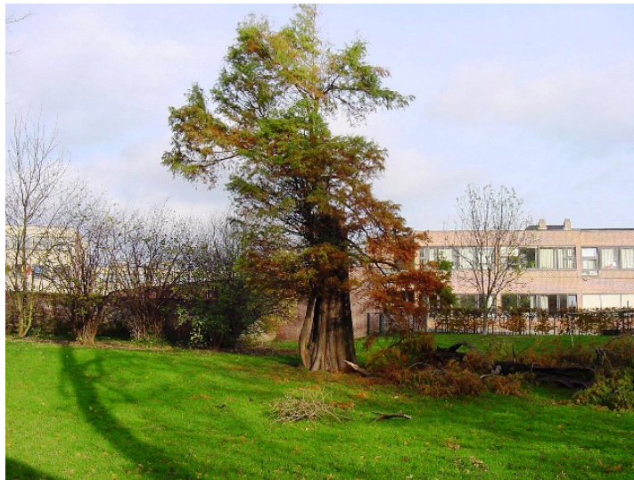
Cahier16_Ooievaarsnest_03