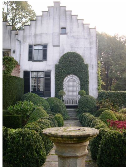
Met buxussen omzoomde parterre bij een voormalige aanhorigheid aan de noordrand van het Morettedomein