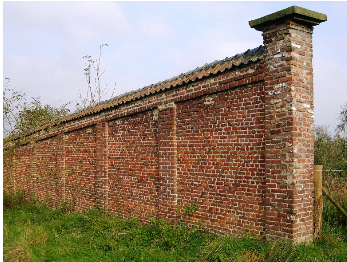
Domein Morette, spijkers en krammen op de naar het zuiden gekeerde muren getuigen van verdwenen leifruit