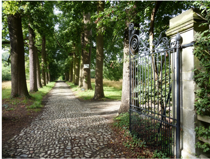
toegangshek en oprijlaan tot het kasteeldomein Morette