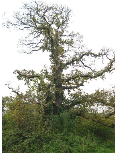
De tamme kastanje in de boomgaard van domein Morette, mogelijk een relict van het 18de-eeuwse Morettebos