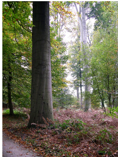
Oud beukenplantsoen langs de noordoostzijde van het domein Morette