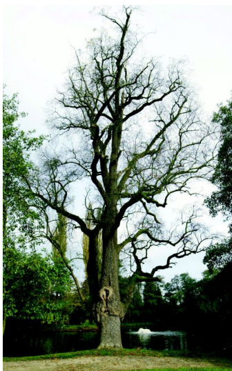
De monumentale smalbladige es bij de vijver van het Katseel van Klein Bijgaarden.