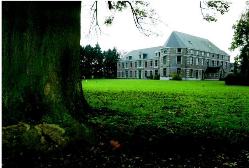
Het kasteel vanuit het park: de apsis van de oude kloosterkerk overleefde alle verbouwingen.