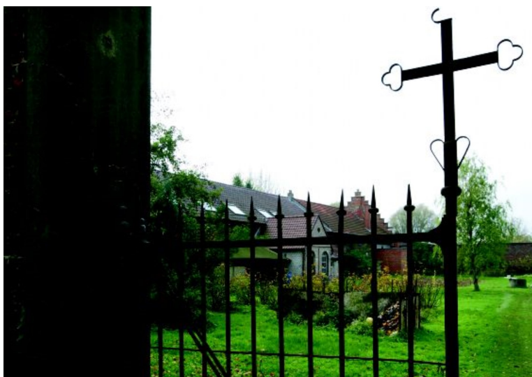
De ommuurde moestuin van het Kasteel van Klein Bijgaarden.