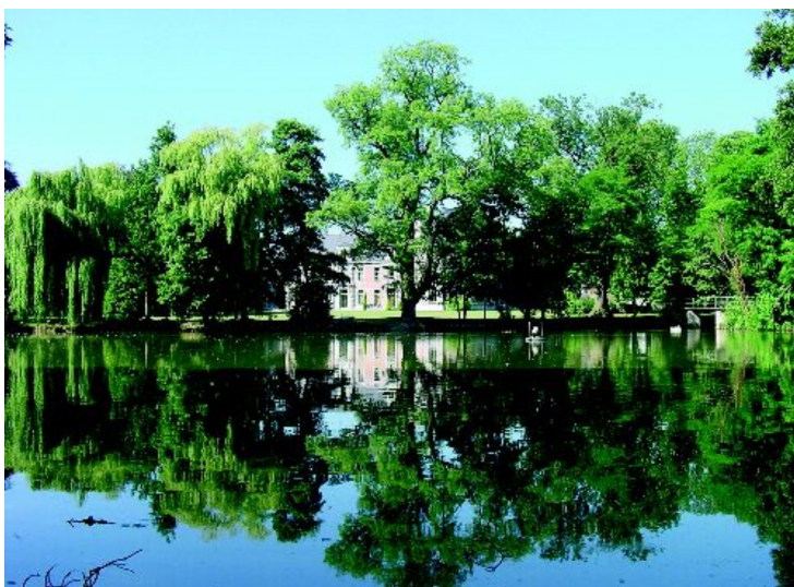
Het Kasteel van Klein Bijgaarden gezien van over de vijver.