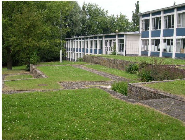
Domein Vijverbeek, schoolgebouw