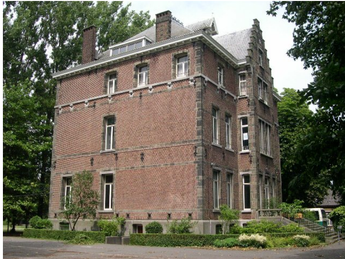
Landhuis op het Domein Vijverbeek