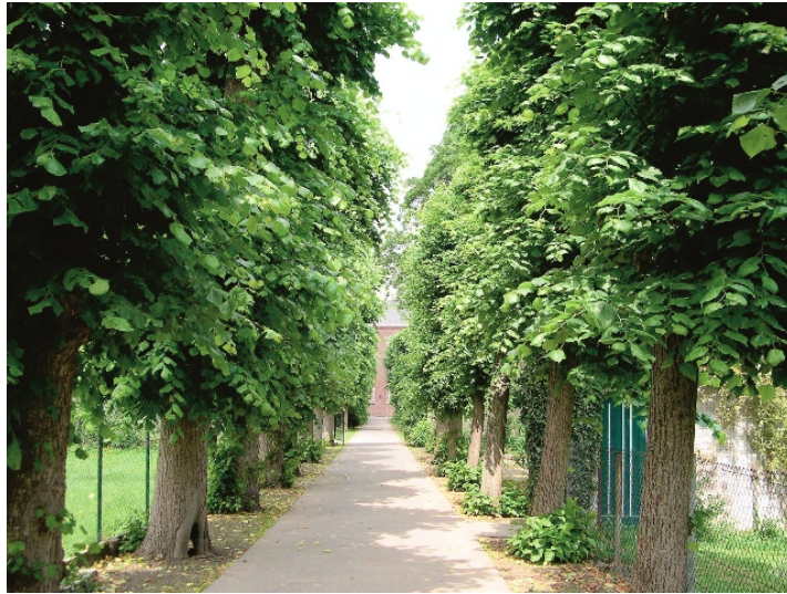
Lindendreef tussen de boerderij en benedictijnenabdij van Affligem