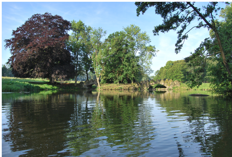
Le deuxième étang et ses ponts de roche.