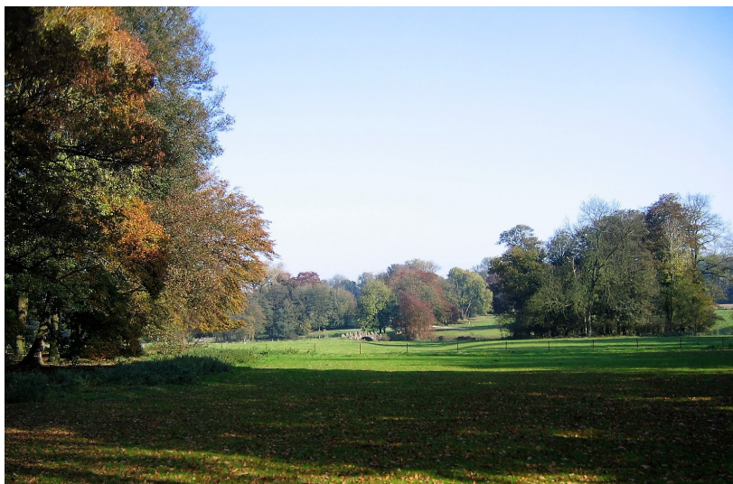
Perspective vers la promenade de ceinture du parc.