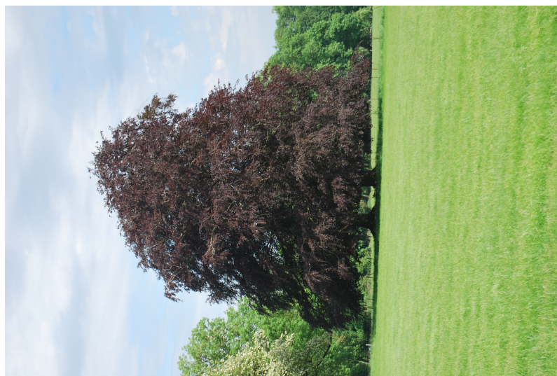
Vieux hêtre pourpre marquant l'extrémité d'un axe perspectif.