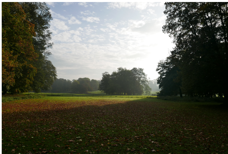
Vue vers le château au-delà du deuxième étang.