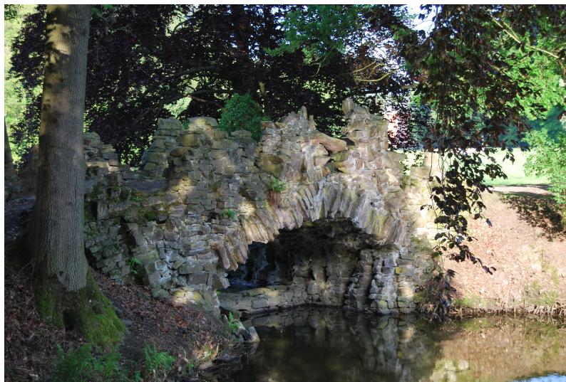
Détail d'un pont de roche. Cliché N. de Harlez, 2019.