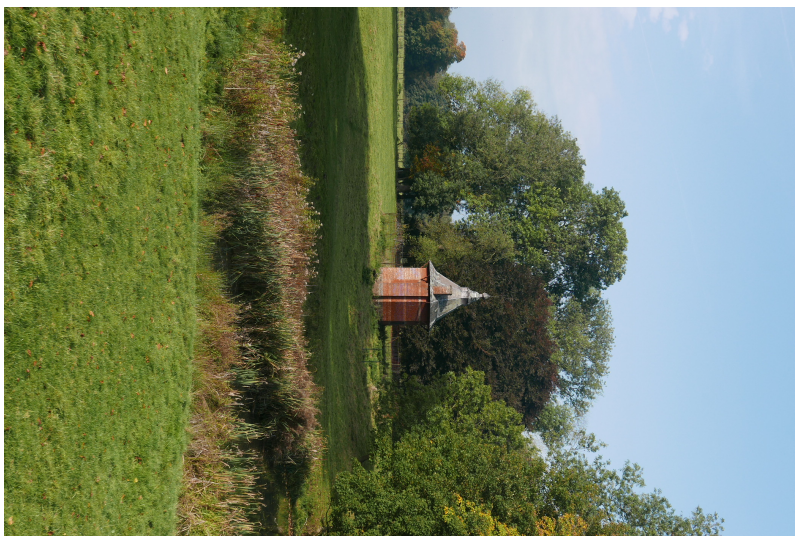
Perspective vers le "Pavillon Madame".