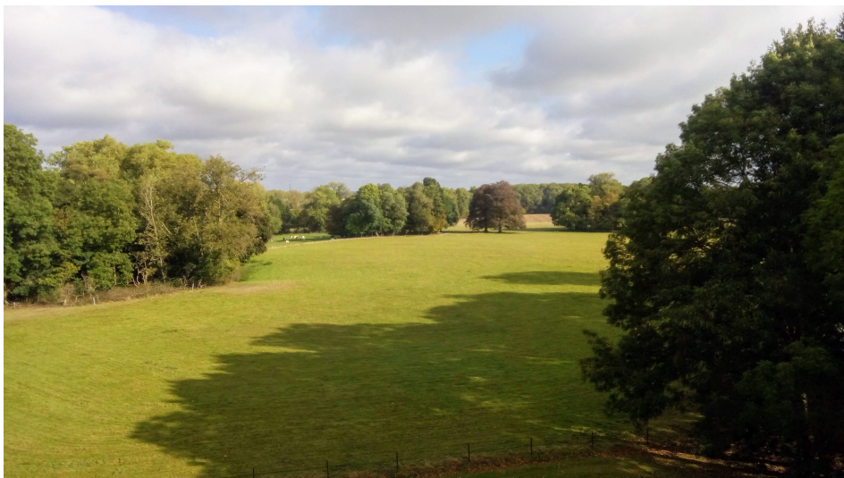
Perspective longue depuis le château.