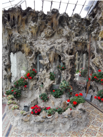
Le jardin d'hiver accolé au château. Vue intérieure.