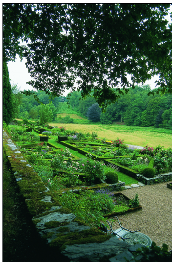
Terrasse médiane de l'ancien potager, redessinée dans les années 1990.