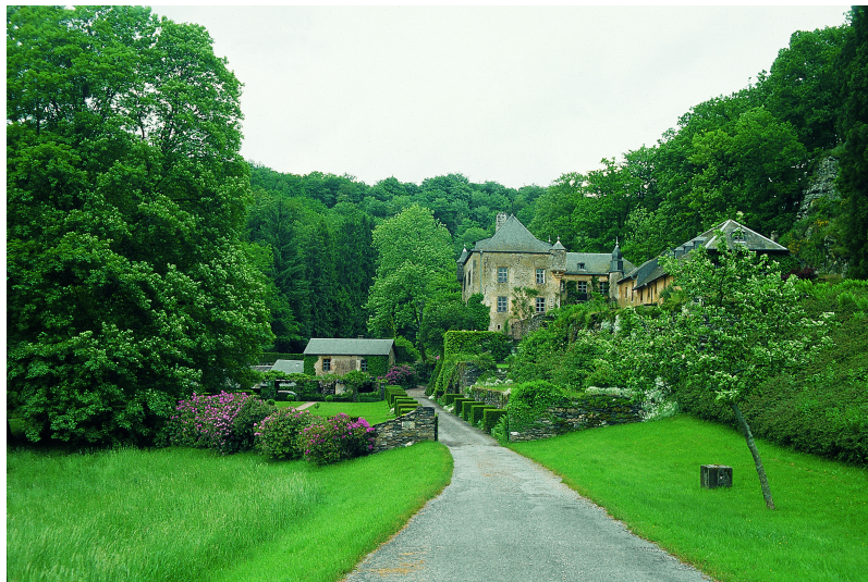
Jardins en terrasses soutenus par de solides murs en pierre de schiste, créés vers 1920 en contrebas de la demeure.