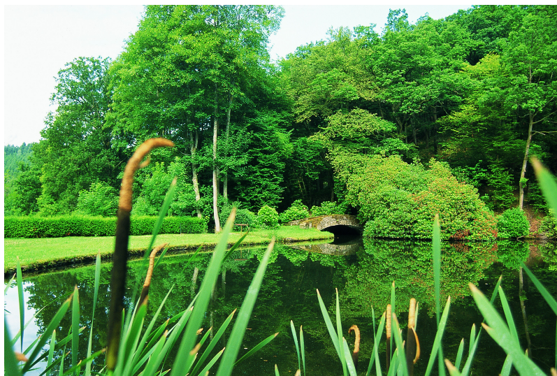
Belle scène paysagère en périphérie de l'ancienne retenue d'eau.