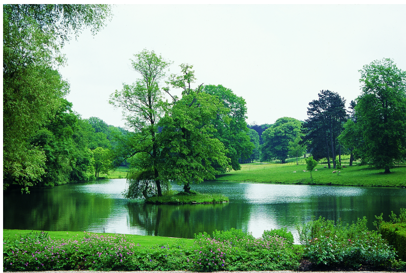
L'ancien réservoir des forges transformé en étang paysager par Louis Fuchs vers 1880.