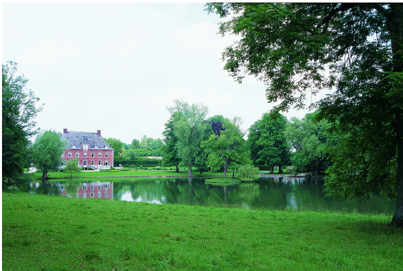
L'ancien bassin des forges transformé en étang occupe le cœur du dispositif paysager.