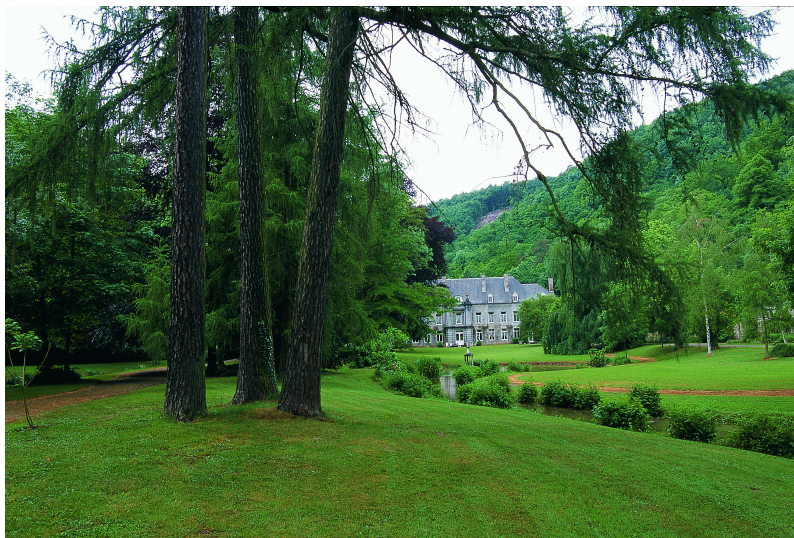
Un important bras d'eau dont les berges accueillent diverses plantes des lieux humides traverse les prairies avant de s'élargir pour former un étang aux contours souples dans l'axe de la demeure.