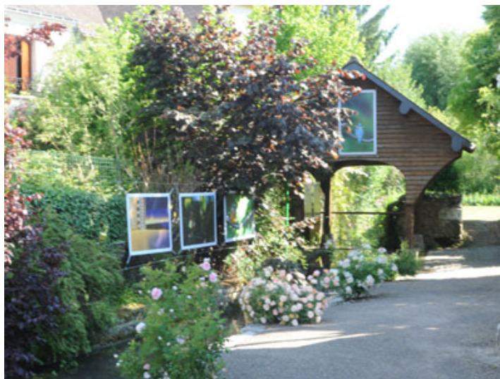
© Christophe Gay Live, Bertrand Cardon et Georges Levêque