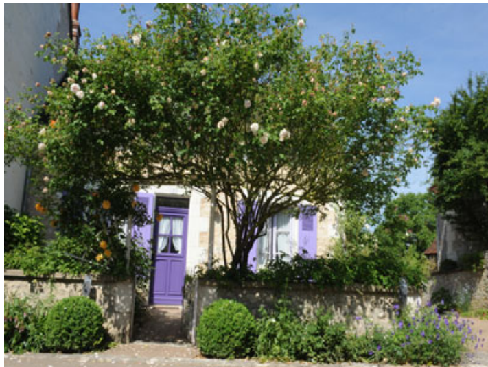
© Christophe Gay Live, Bertrand Cardon et Georges Levêque