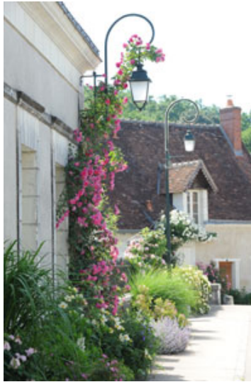
© Christophe Gay Live, Bertrand Cardon et Georges Levêque