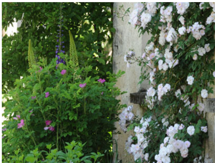
© Christophe Gay Live, Bertrand Cardon et Georges Levêque