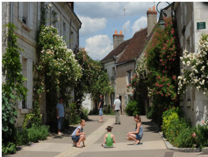
© Christophe Gay Live, Bertrand Cardon et Georges Levêque