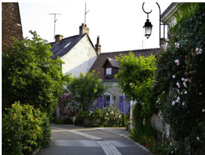
© Christophe Gay Live, Bertrand Cardon et Georges Levêque