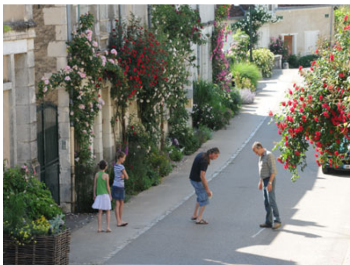
© Christophe Gay Live, Bertrand Cardon et Georges Levêque