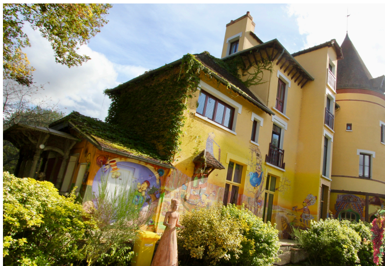
Fresque de Os Gemeos