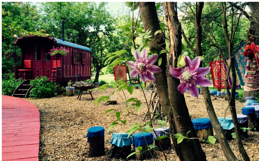
Violet garden