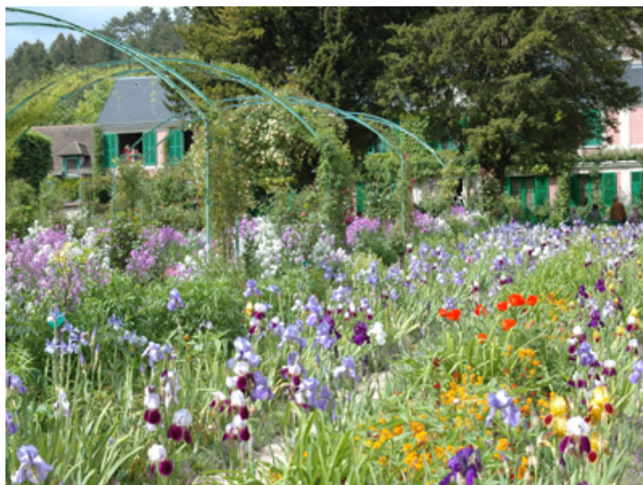
JARDIN CLAUDE MONET