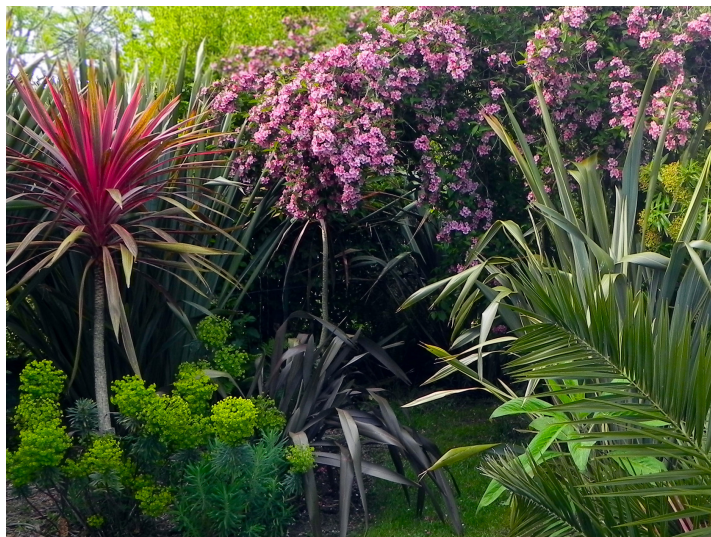
Jardin Exotique @Marie-Anne Bégué