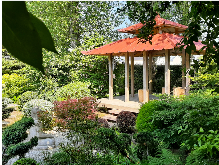
Jardin Japonais @Marie-Anne Bégué