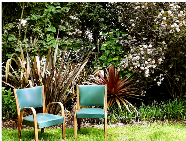
Jardin Rose et Pourpre