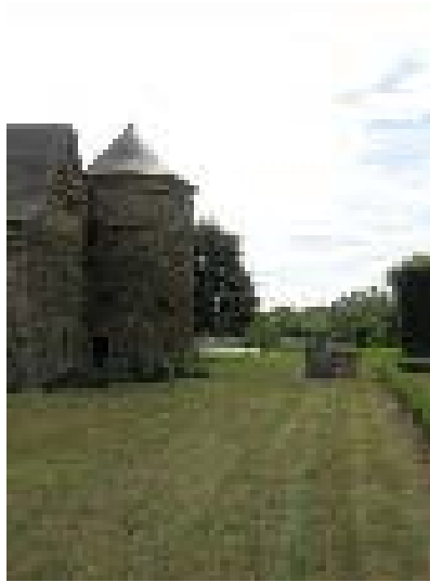
Pigeonnier et puits.