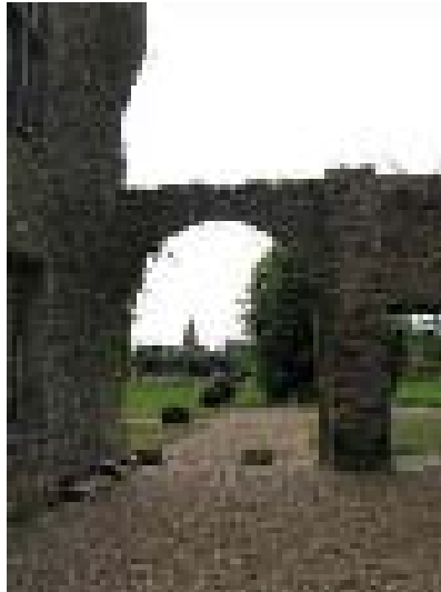
Arcade la cour.