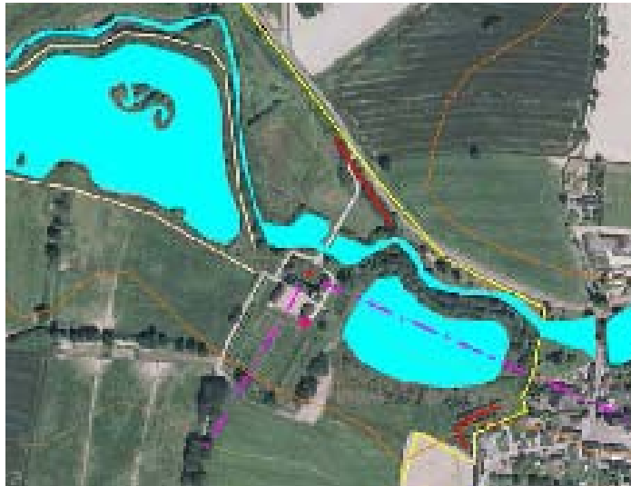
Photographie aérienne 2002 retravaillée en 2008.