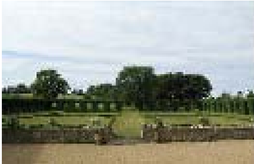
Jardin régulier derrière la cour.