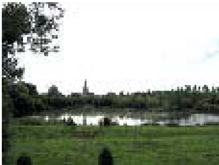
Promenade de l'étang est.