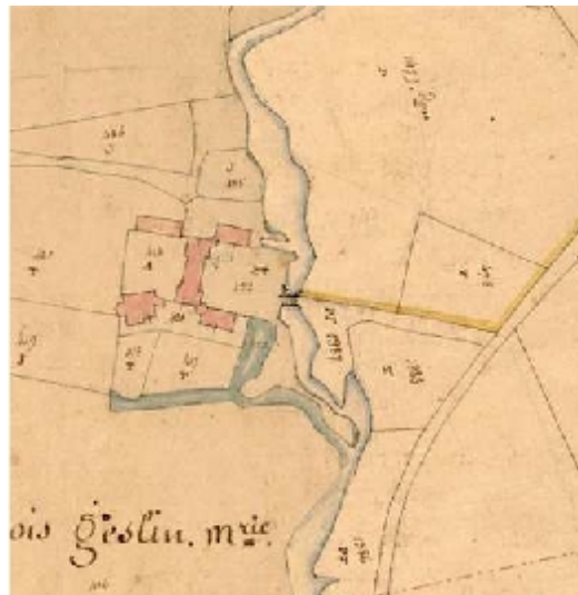
Cadastre de 1833.