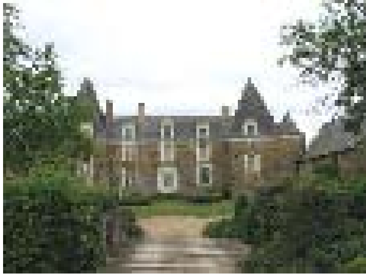
Cours d'honneur et arrivée.