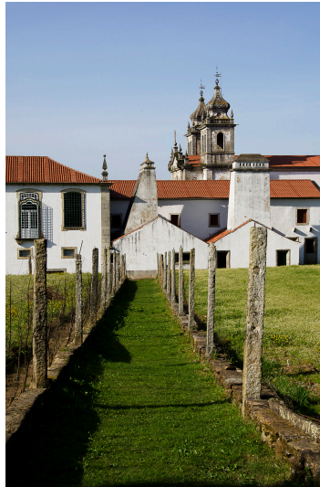
Carta de Bacias Visuais