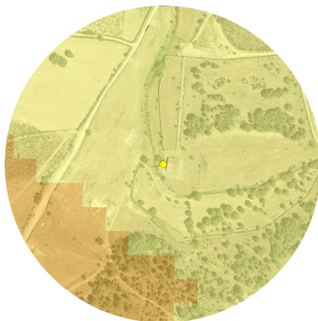
Carta de Declives