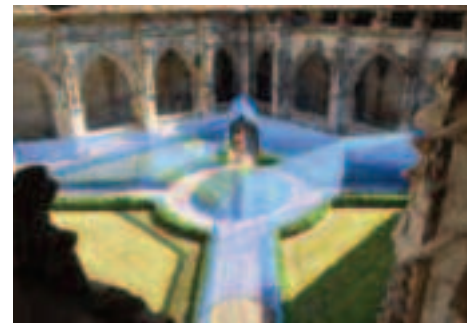
Voûtes Filantes Atelier Yōkyōk